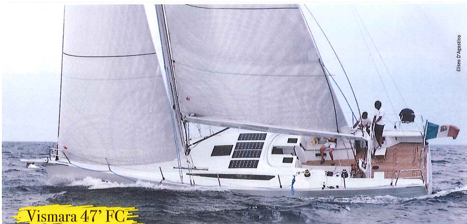
Vismara 47' FC